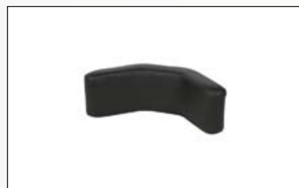
Coussin d'appui-tête réglable Wing Comfort.