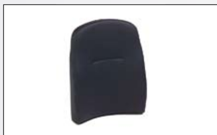
Dossier Comfort 50 cm.