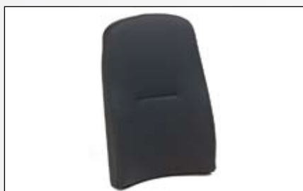
Dossier Comfort 57 cm.