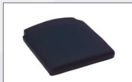
Coussin en mousse inerte.