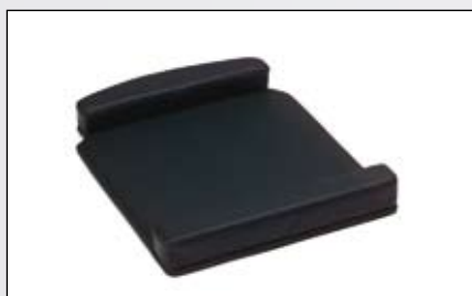
Base d'assise avec rebord.