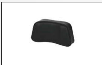
Coussin d'appui-tête réglable standard Comfort.