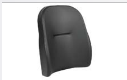
Dossier Passif Comfort.