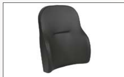
Dossier Actif Comfort.