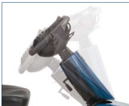
Colonne de direction facilement réglable de manière individuelle pour une assise confortable