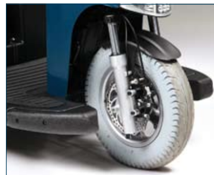
La suspension avant dotée d'amortisseurs et le frein à disque assurent un excellent confort de conduite.