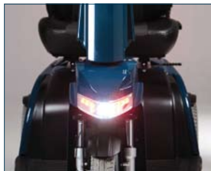
Lampes LED avec le marquage CE, feux avant et arrière, clignotants et feux stop

Il existe par ailleurs une large gamme d'options, vous pouvez ainsi personnaliser le scooter selon vos besoins et vos préférences. Ainsi, outre les commandes ergonomiques actionnées par la main/le pouce, on peut opter pour une poignée Twist (manette), une pédale ou une combinaison des deux.