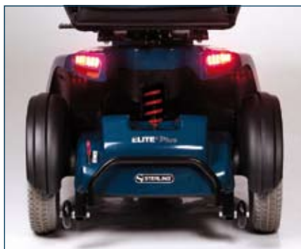
Suspension arrière hydraulique réglable, mécanisme de roue libre et système d'anti-bascule