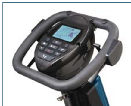
Conduite ergonomique avec un écran LCD synoptique et des boutons soft-touch faciles à manipuler.