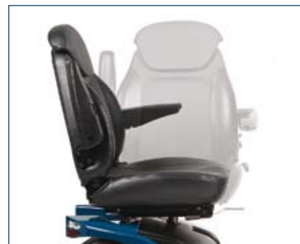
Siège confortable entièrement réglable de manière individuelle (pivotant à 360°) avec soutien lombaire latéral