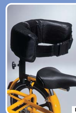
brede heupsteun met riem