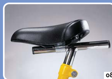
zadelpen in T-vorm