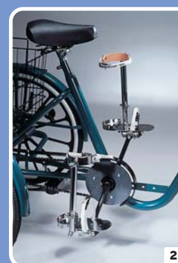
voetplaat met beenbeugels

In onderstaande tabel krijgt u een volledig overzicht van de verschillende modellen, hun precieze eigenschappen, de verkrijgbare kleuren en de beschikbare opties.