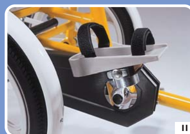
voetplaten met klittenband (klein model)