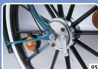
trommelrem, ingebouwd in de as van het voorwiel