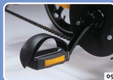
trappers met klittenband