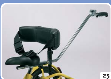
begeleidersstang met heupsteun en riem