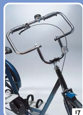
rechthoekig stuur (groot model)